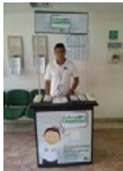
Monitor ciudadano en la Fiscalía Regional de Ecatepec

Cabe decir que las Agencias del Ministerio Público, los Módulos de Atención Oportuna y las Fiscalías, serán evaluadas a través de cuatro ejes: calidad en la atención, actos de ilegalidad e irregularidades, condiciones internas y, condiciones externas para proveer el servicio . Los resultados serán presentados en reportes mensuales e informes semestrales, los cuales serán dados a conocer a las autoridades correspondientes y medios de comunicación. Además, con base en experiencias y resultados de las evaluaciones, MUCD seguirá presentando propuestas y exigencias ciudadanas que permitirán mejorar la calidad del servicio y erradicar los actos de ilegalidad e irregularidades que se cometen al interior de las agencias.